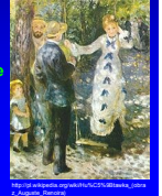
Auguste Renoir: „Hustawka”

Powstaje ulotny moment, który jest tu i teraz - niepowtarzalna chwila, która każdy odbiera inaczej.